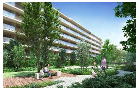
▲コミュニティガーデン完成予想 CG

敷地面積約 16,000 m 2 の広大な敷地を生かし、さまざまな共用部を計画しました。ダンスやフィットネスなどに利用できる「ウェルネススタジオ」、集中して作業したい時やリモートワーク時に便利な「パーソナルブース」、テーブルや座卓でボードゲームを楽しんだり、パーティー会場として利用することのできる「コミュニティルーム」、遠方からお越しになるゲストをもてなす「ゲストルーム」、「洗車スペース」や「みんなの洗い場」など、ゆとりあるランドプランを計画いたしました。災害時には地域の住民の方々にも開放可能でつながりを創出する「コミュニティガーデン」は、第1期ご来場の皆さまにも特にご評価いただき、街と調和する共同住宅を目指しております。