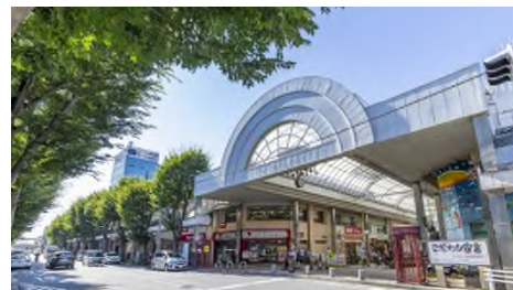
▲JUJU きたなら習志野台商店街

徒歩 5 分圏内に、約 29 店舗が集まる「JUJU きたなら習志野台商店街」や、「西友 北習志野店」、野球場として利用できる多目的広場やテニスコートを備えた「北習志野近隣公園」が位置し、日々の生活も便利です。駅徒歩 2 分が叶える快適なアクセスと、住居系地域ならではの穏やかな住環境は、地元から中広域の方まで幅広い方々にご評価いただいております。