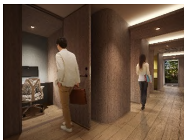
▲パーソナルブース完成予想 CG